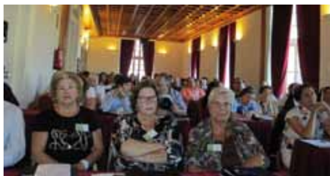
Miembros de las Juntas Directivas de las 17 Asociaciones y gestores de Lares conforman el público de las Jornadas nacionales

Apuntaba además la idea de aprovechar la experiencia de las órdenes religiosas que han sabido adaptarse en el tiempo para atender a los colectivos más vulnerables.